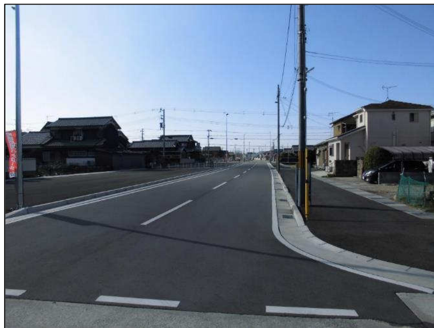
大塩曽根線 (北から南)整備中