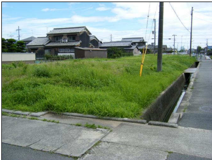
大塩曽根線 (北から南)整備前