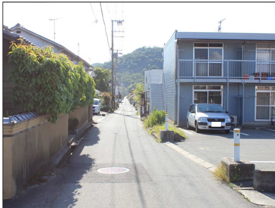
四ツ池線ほか1路線（東から西）事業前