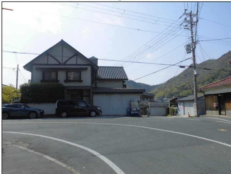
四ツ池線ほか1路線（終点から西）事業前