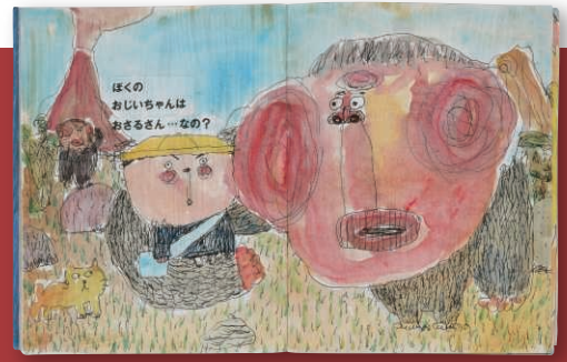
「おひさまとちよつと」のおひさまさん 2016年