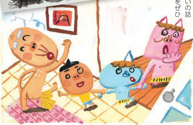
「おひさまとちよつと」のちよつとさん 2016年