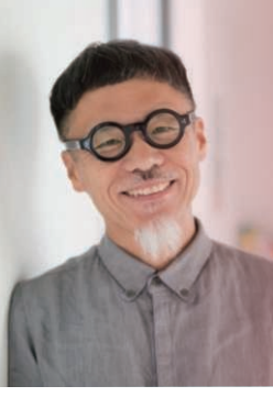
「おひさまとちよつと」のおひさまさん 2016年

1961年、大阪府藤井寺市生まれ。グラフィックデザイナーを経て、「おひさまとちよつと」のちよつとさんのおひさまさん(2016年出版)で絵本デビュー。『ちよつとちよつと』(絵本館)、『へいわつてすてきなね』(小学館)など、150冊以上の絵本を発表。独自のタッチとユーモアあふれる作風で、大人から子どもに大人気。また、社会的テーマにも意欲的にとらんとする。『おたまさんのおかいたん』で第34回講談社出版文化賞絵本賞、『ほくがラーメン』で第13回日本絵本賞と第57回小学館児童出版文化賞、『あめだま』で第24回日本絵本賞翻訳絵本賞、『マンマルさん』で第67回産経児童出版文化賞翻訳賞など、多数受賞。毎日放送「ちよつとちよつと」土曜のよんちゃんTVでのスケッチ散策で、お茶の間に人気。好きなものは温泉とお酒、嫌いなものは甘いもの。