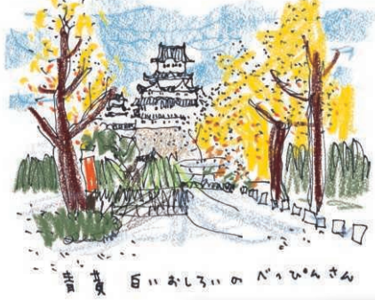
「おひさまとちよつと」のちよつとさん 2016年