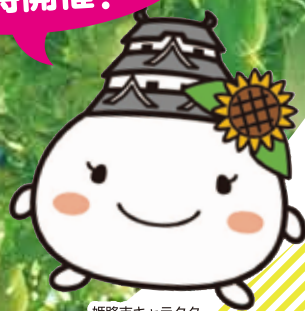
姫路市キャラクター しろまるひめ