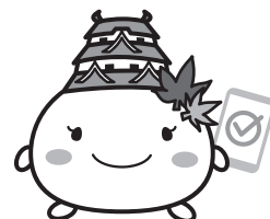
姫路市キャラクター しろまるひめ