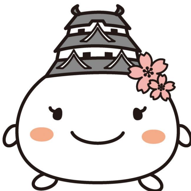
姫路市 イメージキャラクター 「しろまるひめ」