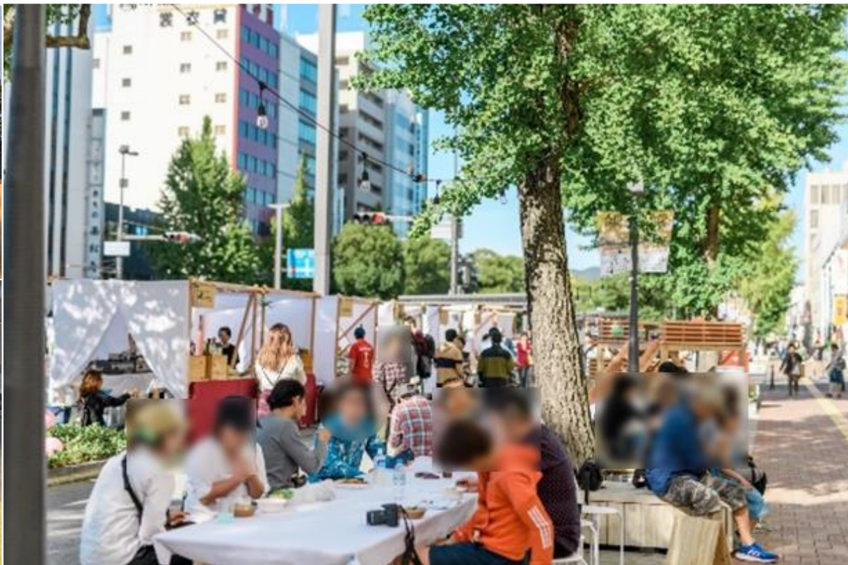
大手前通り利活用社会実験「ミチミチ」状況写真

これまでの取組を踏まえ、 「大手前通り」というブランド をほこみちでも継続し、さらなる賑わいを