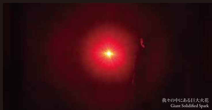
我々の中にある巨大火花 Giant Solidified Spark