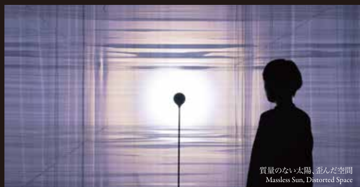
質量のない太陽、歪んだ空間 Massless Sun, Distorted Space

【チームラボとは】アートコレクティブ。2001年から活動を開始。集団的創造によって、アート、サイエンス、テクノロジー、そして自然界の交差点を模索している国際的な学際的集団。アーティスト、プログラマー、エンジニア、CGアニメーター、数学者、建築家など、様々な分野のスペシャリストから構成されている。チームラボは、アートによって、自分と世界との関係と新たな認識を模索したいと思っている。