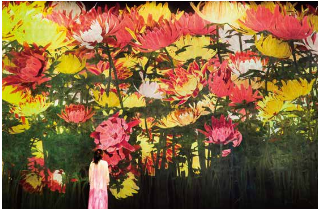
前期 《増殖する無量の生命》©チームラボ 1st Term | Proliferating Immense Life