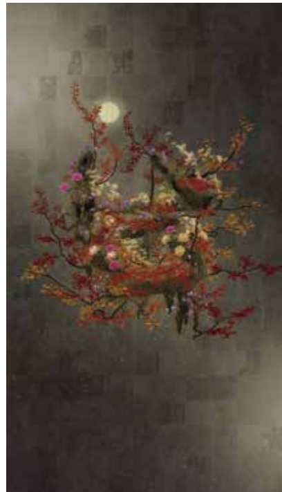
前期 《生命は生命の力で生きているII》©チームラボ 1st Term | Life Survives by the Power of Life II

チームラボは、アートによって人類の世界認識を変えようとしています。本展において、鑑賞者は、自分が立つ現実空間と、彼らが展開する作品空間がつながる「ボーダレス」な空間—超主観空間—に“没入”する経験を通じて、この世界が連続性の上に成り立っていることを身体的に認識することでしょう。近年、チームラボの探求はさらに深化を遂げ、「生命とは何か」というテーマのもと、次々と作品を発表しています。「私という存在は、心と体とそれらと連続する環境によって創られている」と彼らはいいます。生物と無生物という認識の境界をも超えようとするチームラボの現在地を、前期・後期の展示替えを通して長大なスケールで展開します。