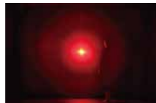
我々の中にある巨大火花 / Giant Solidified Spark