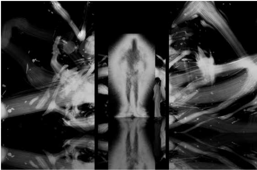
前期 | 《反転無分別-Light in Dark》、《Dissipative Figures-Human, Light in Dark》©チームラボ(参考画像) 1st Term | Reversible Rotation-Light in Dark / Dissipative Figures-Human, Light in Dark(Reference images)