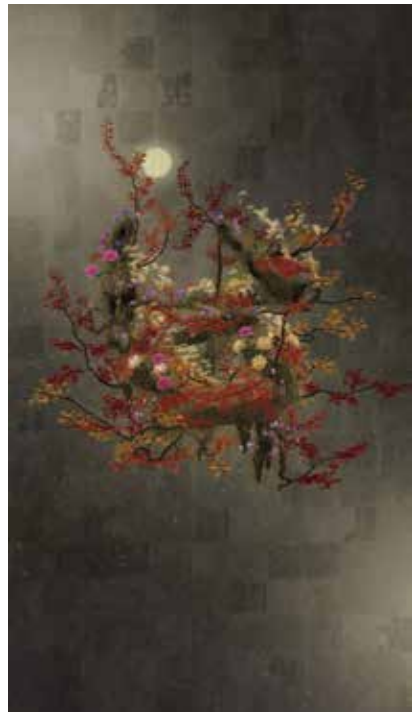
前期 | 《生命は生命の力で生きているII》©チームラボ 1st Term | Life Survives by the Power of Life II

チームラボは、アートによって人類の世界認識を変えようとしています。本展において、鑑賞者は、自分が立つ現実空間と、彼らが展開する作品空間がつながる「ボーダレス」な空間—超主観空間—に“没入”する経験を通じて、この世界が連続性の上に成り立っていることを身体的に認識することでしょう。近年、チームラボの探求はさらに深化を遂げ、「生命とは何か」というテーマのもと、次々と作品を発表しています。「私という存在は、心と体とそれらと連続する環境によって創られている」と彼らはいいます。生物と無生物という認識の境界をも超えようとするチームラボの現在地を、前期・後期の展示替えを通して長大なスケールで展開します。