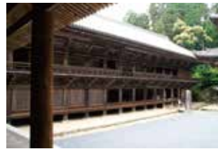
©書寫山圓教寺 我々の中にある巨大火花 / Giant Solidified Spark ©チームラボ