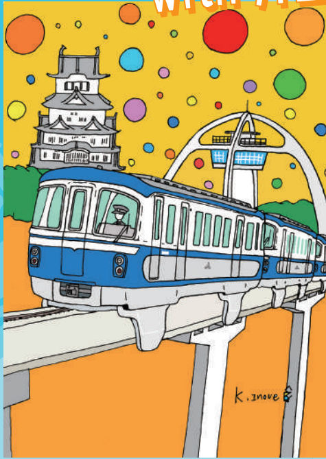
「姫路モノレール」井上広大 2020年(個人蔵)