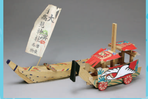
舟の郷土玩具より(当館蔵)