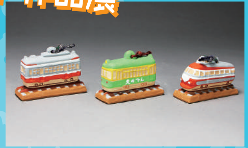
鉄道の土鈴より(当館蔵)