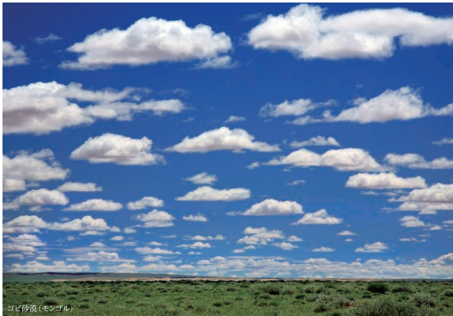
ゴビ砂漠 (モンゴル)