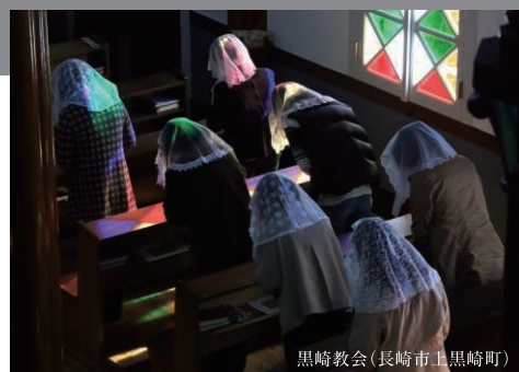
黒崎教会(長崎市黒崎町)