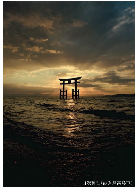
白鬚神社(滋賀県高島市)

司馬さんが伝えようとした言葉とシンクロする、 普遍性を持った風景に出会う瞬間があるのだ。 小林 修