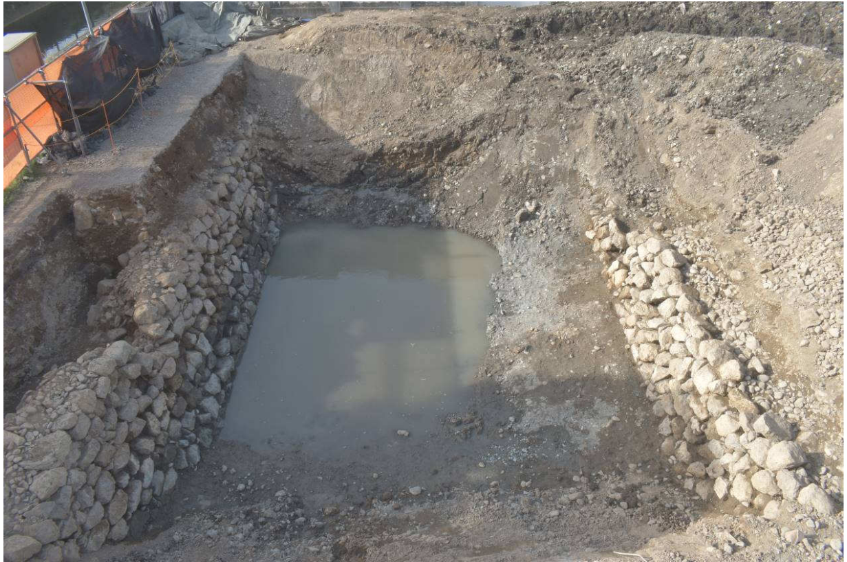
調査区中央部 堀跡石垣全景（南から）※現地説明会では調査区南部の調査成果をご覧ください。