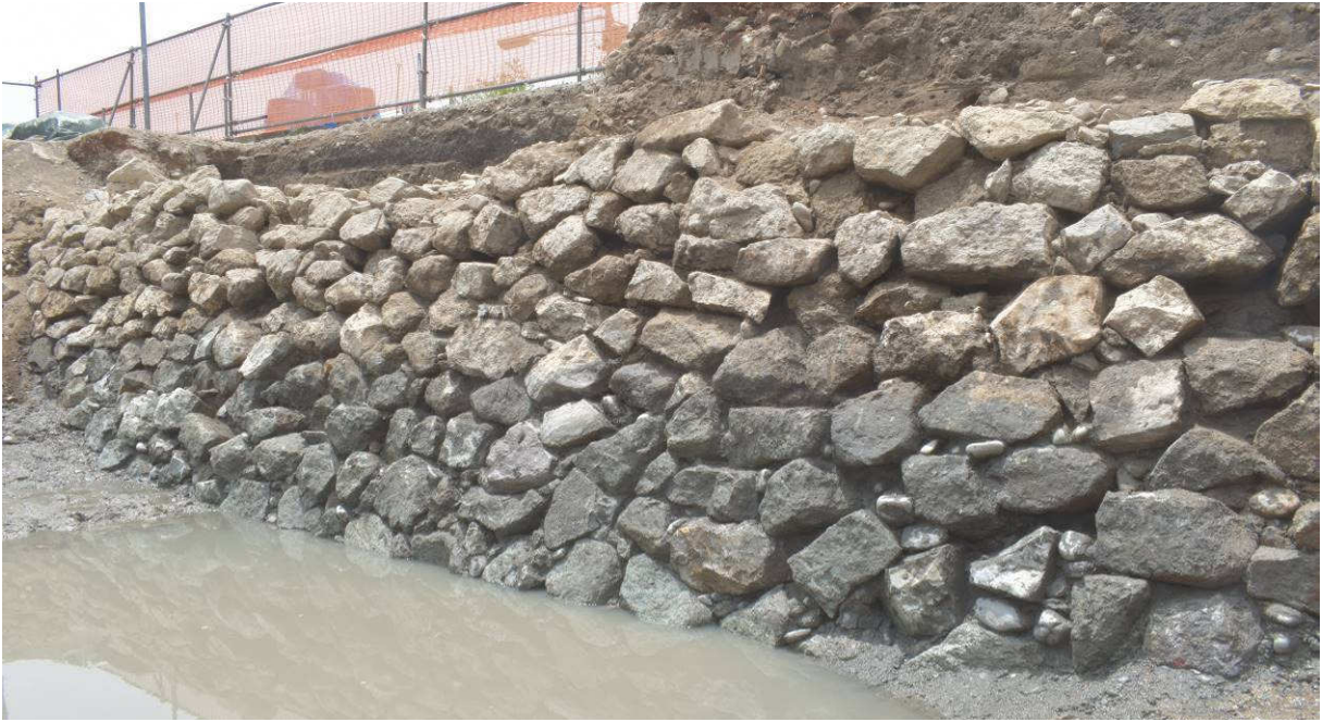
調査区中央部 西面石垣（北東から）※現地説明会では調査区南部の調査成果をご覧ください。