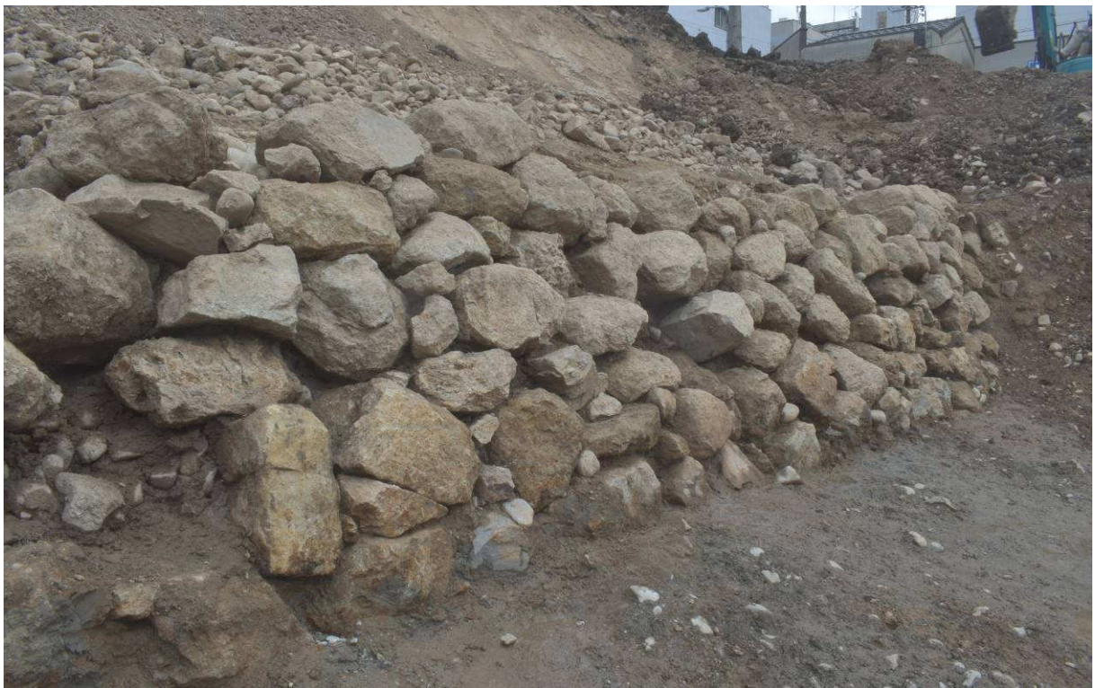
調査区中央部 東面石垣（北西から）※現地説明会では調査区南部の調査成果をご覧ください。