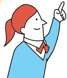
※画像はすべてイメージです