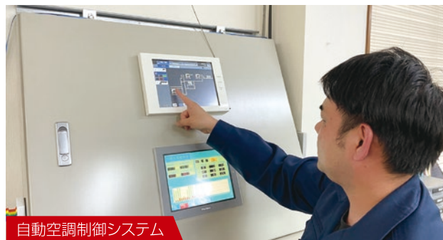
自動空調制御システム