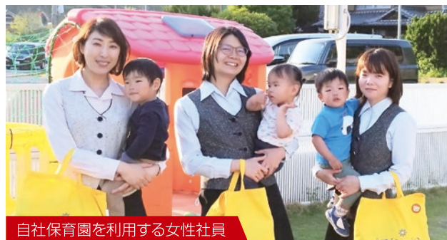
自社保育園を利用する女性社員