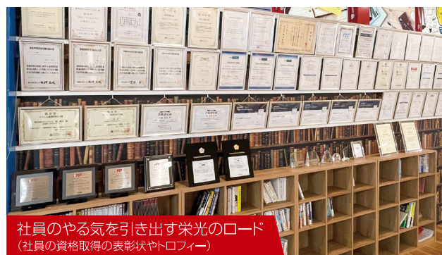
社員のやる気を引き出す栄光のロード (社員の資格取得の表彰状やトロフィー)