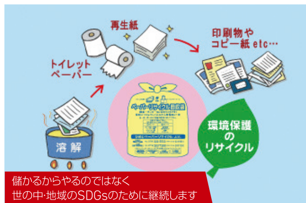
儲かるからやるのではなく 世の中・地域のSDGsのために継続します