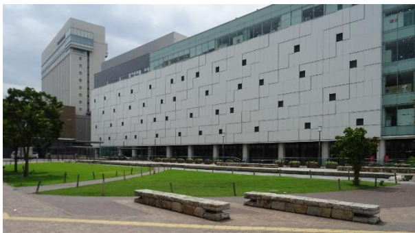
姫路駅北にぎわい交流広場