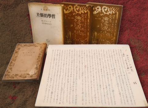
椎名麟三旧蔵の哲学書(キルケゴール「死に至る病」 「哲學的斷片」・ニーチェ「如是説法 ツァラトゥストラ」)と ノート「キルケゴール研究」

本展では、時代の動きに呼応し、刺激され、反発しながら活躍したそれぞれの作家人生と発表作をたどるほか、姫路城という共通テーマから阿部の短編集「城―田舎からの手紙」と椎名の戯曲「姫山物語」にも注目。戦後において阿部が土壌をはぐくみ、椎名が継承・発展させた姫路の文化振興の軌跡も取り上げます。映画や演劇、ドラマなど、小説にとどまらない作家たちの創作活動もお楽しみください。