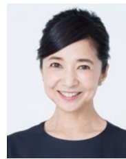
併優 世界遺産検定1級合格 宮崎 美子氏