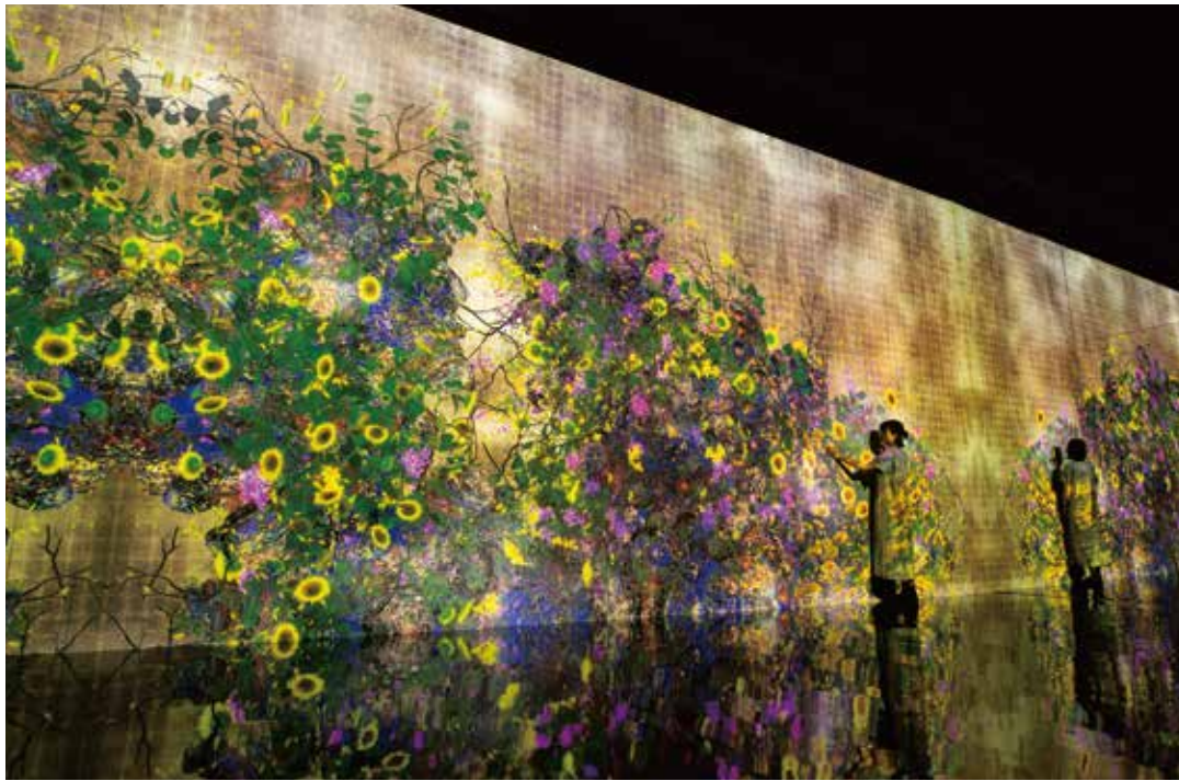
後期 | 《永遠の今の中で連続する生と死、コントロールできないけれども共に生きる》©チームラボ (参考画像) 2nd Term | Continuous Life and Death at the Now of Eternity, Cannot be Controlled but Live Together (Reference images)