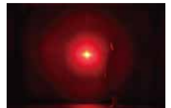
©書寫山圓教寺 我々の中にある巨大火花 / Giant Solidified Spark ©チームラボ