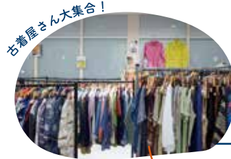
古着屋さん大集合!