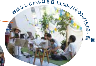
おはなしじかんは各日 13:00~14:00/14:00~15:00 開催!