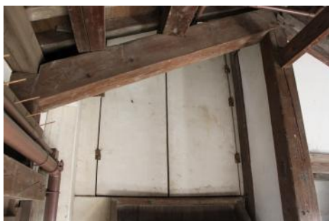
大天守への扉(初公開)