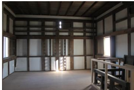
西小天守 内観(初公開)