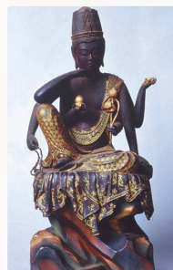
えんぎようじ、あつひにょいりんかんせおんぼさつ 園教寺と六臂如意輪観世音菩薩