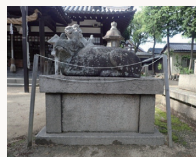
浜の宮天満宮の神牛

日本海や瀬戸内海沿岸には、山を風景の一部に取り込む港町が点々とみられます。そこには、港に通じる小路が随所に走り、通りには広大な商家や豪壮な船主屋敷が建っています。また、社寺には奉納された船の絵馬や模型が残り、京など遠方に起源がある祭礼が行われ、節回しの似た民謡が唄われています。これらの港町は、荒波を越え、動く総合商社として巨万の富を生み、各地に繁栄をもたらした北前船の寄港地・船主集落で、時を重ねて彩られた異空間として今も人々を惹きつけてやみません。