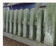
九所御霊天神社の玉垣