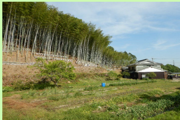
集落周辺森林整備事業