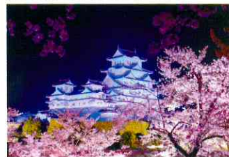
大西 勲 様 (姫路市)