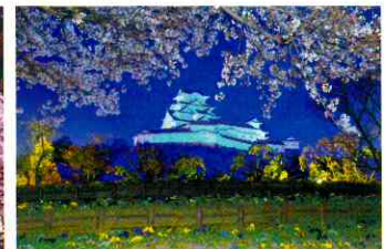
矢野 正樹 様 (徳島県鳴門市)

企業・団体・組織様/10,000円(一口) ※協賛として啓発リーフレットにお名前を入れさせて頂きます。