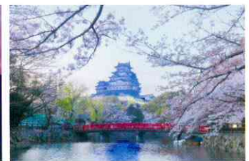
黒見 眞 様 (姫路市)