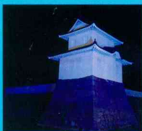
赤穂城跡 大手隅櫓 （赤穂市）