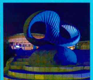
うるおい交流館エクラ （小野市）