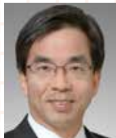
カリオ カズオミ 苅尾 七臣 日本高血圧学会 理事長 自治医科大学内科学講座 循環器内科学部門 教授