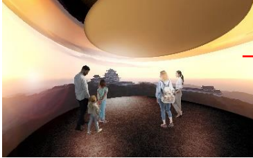
インフォメーションシアター