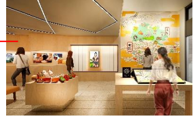
観光案内スペース