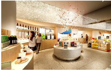
地場産品等の展示・販売スペース