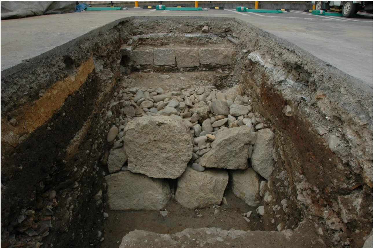
平成29年の調査で見つかった備前門跡の石垣（南から）