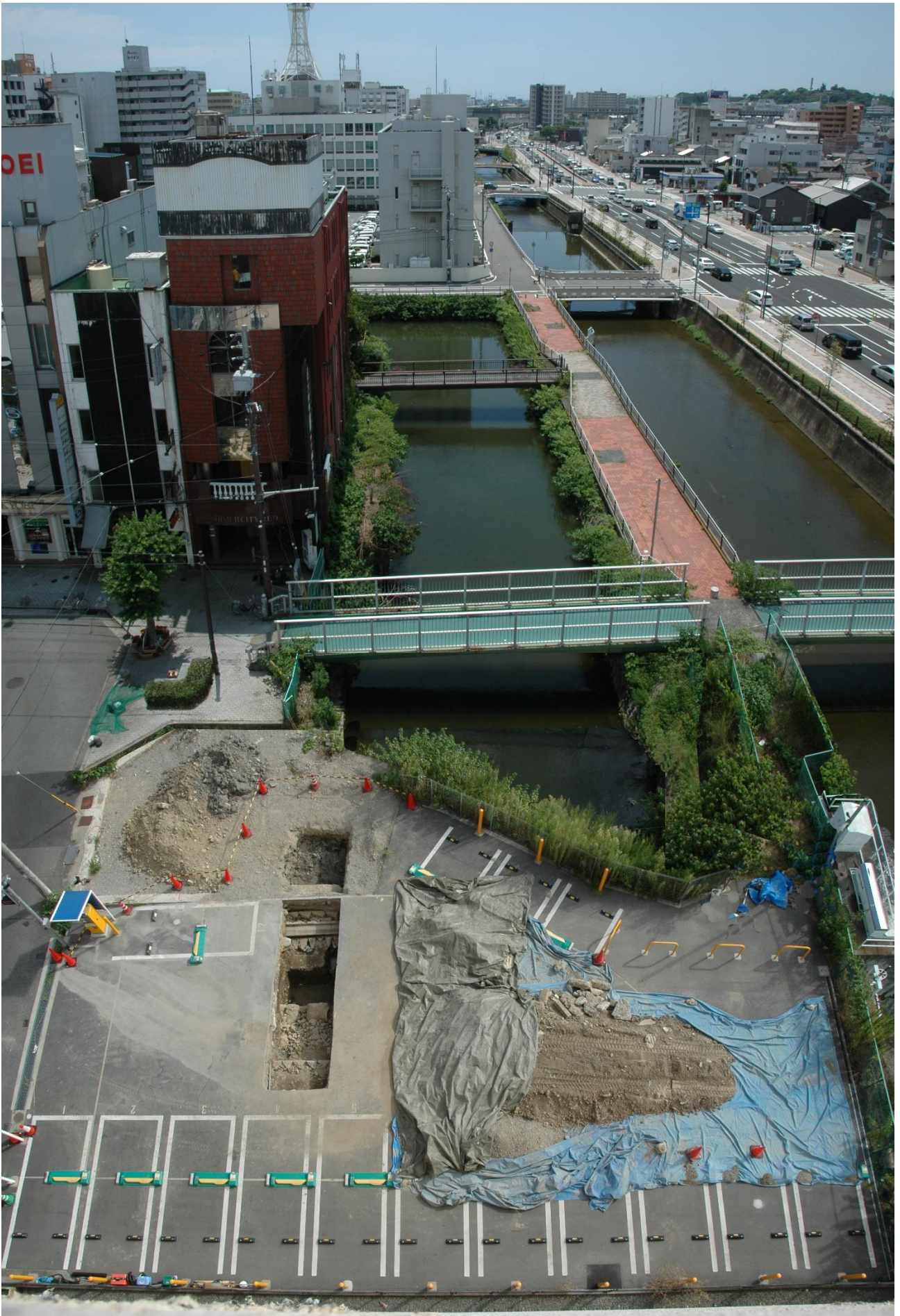
平成29年の調査状況（北から）