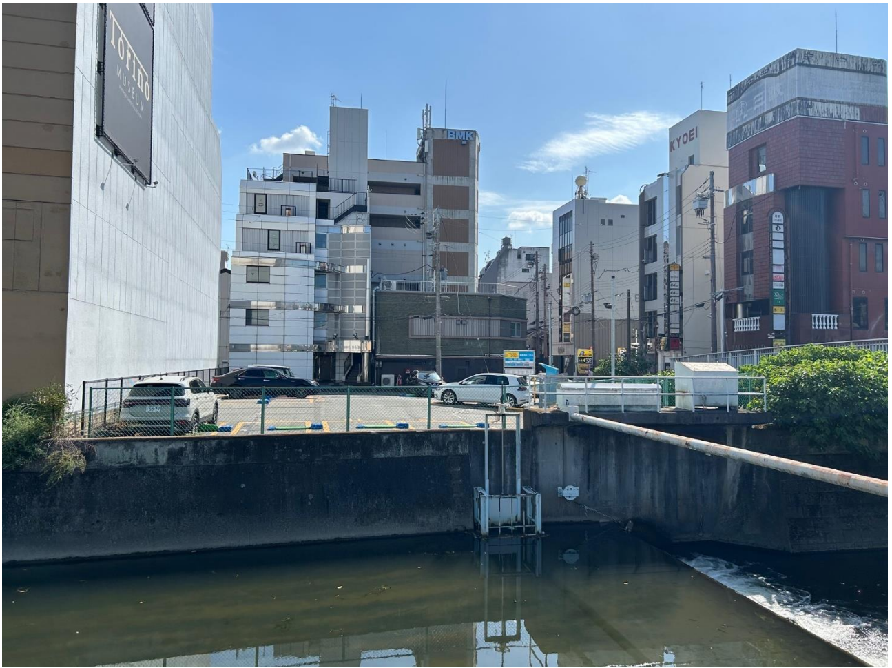
対象地の現況写真（西から）